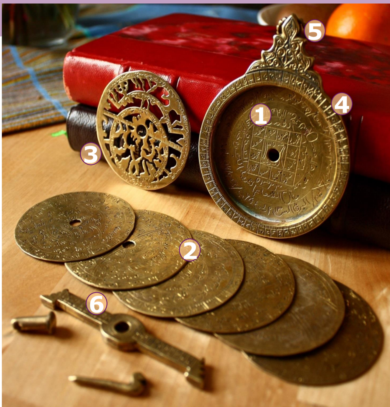
astrolabe Afrique du Nord, XVIII e s

D'usage limité pour les observations astronomiques, il sert surtout pour l'astrologie, l'enseignement de l'astronomie, et le calcul de l'heure le jour par l'observation du soleil ou pendant la nuit par l'observation des étoiles. On l'utilisait aussi pour des relevés topographiques.