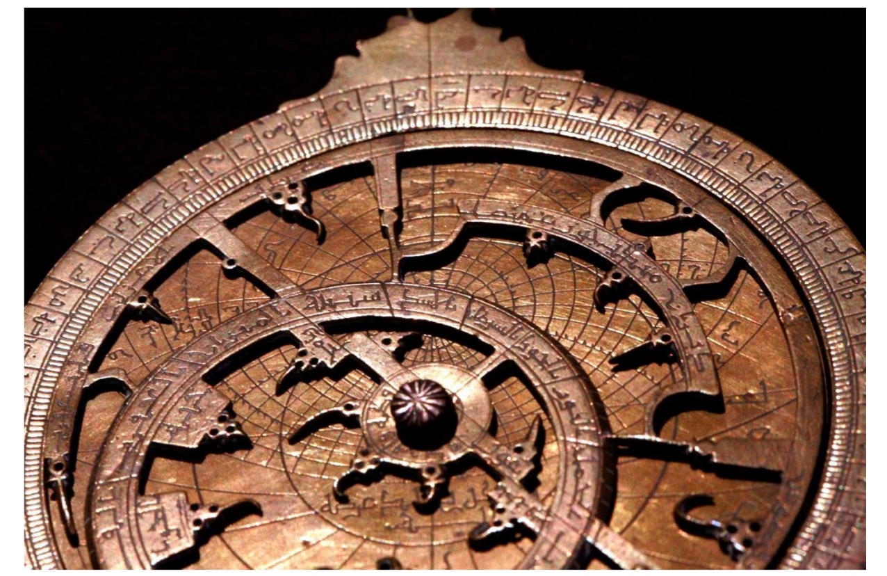
astrolabe planisphérique, Maroc, XVI e s

EN GREC, ASTROLABE SIGNIFIE "PRENDRE LES ÉTOILES", PARCE QU'AVEC CET INSTRUMENT DE MESURE, ON PEUT EN EFFET DÉTERMINER LA POSITION DES ASTRES ET MIEUX "LIRE" LE CIEL. CES SUPERBES OBJETS ONT JOUÉ UN RÔLE CONSIDÉRABLE DANS LA SCIENCE ARABE.