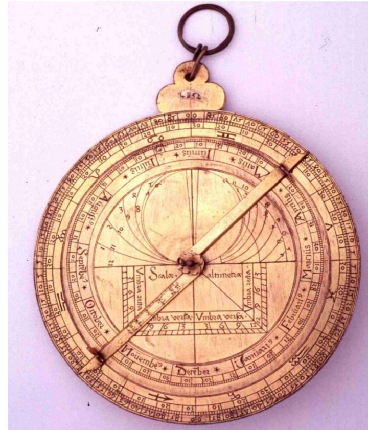
Astrolabe allemand de Regiomontanus, XV e s